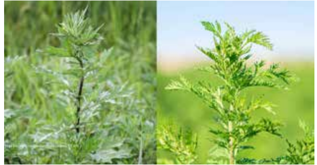
Artemisia vulgaris (linkes Bild) im Vergleich zu Artemisia annua (rechtes Bild)