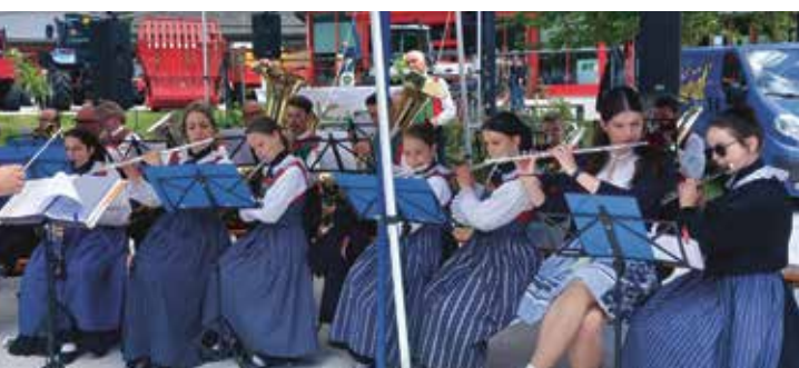
Beim 50-Jahr-Jubiläum der SBJ Martell in Trattla

Mit großer Freude umrahmte die Musikkapelle Martell das 50-jährige Jubiläum der Bauernjugend Martell musikalisch. Bei bester Stimmung und einem vollen Festplatz trugen die Musikantinnen und Musikanten mit schwungvollen (Marsch)Klängen musikalisch zum Fest bei. Ein herzlicher Dank an die Bauernjugend für die Einladung und die schöne Feier!