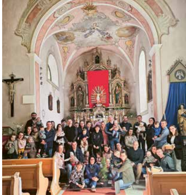
Viele Familien waren der Einladung gefolgt und freuten sich über die Jahrgangsbaumfeier