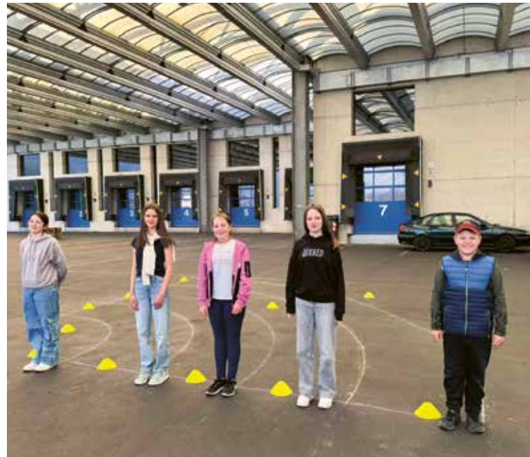
Bei der Marschierprobe in Schlanders

Einen ganz besonderen Abend erlebte die Musikkapelle Martell bei einem gemeinsamen Ausflug in die Stadthalle Bozen. Dort stand das Musical „Der König der Löwen – The Music Live in Concert“ auf dem Programm. Die mitreißende Musik, die bekannten Melodien, die eindrucksvolle Atmosphäre (sowie Popcorn und leckere Getränke) sorgten für einen schönen Gemeinschaftsabend.