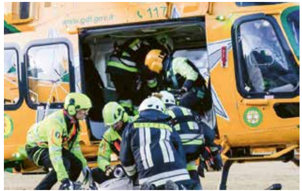
Ausrüstung wurde mit Hubschraubern an die Brandherde gebracht.