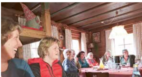
Lehrfahrt ins Ultental

Am Samstag, den 22. März 2025, führte die erste Lehrfahrt des Jahres die Marteller Bäuerinnen ins idyllische Ultental. Der Tag begann mit einer spannenden Führung beim Mittereggenhof in St. Pankraz, wo die Teilnehmerinnen Einblicke in das Leben und Arbeiten auf dem Bergbauernhof erhielten. In der gemütlichen Bauernstube wurden regionale Köstlichkeiten verkostet und nach der Besichtigung der Backstube konnten vorbestellte Brotpakete mit nach Hause genommen werden. Ein weiterer Höhepunkt war der Besuch bei den „Bierbrauerinnen“ in St. Walburg. Dort durften die Bäuerinnen verschiedene Biersorten probieren und mehr über das Handwerk des Bierbrauens erfahren. Abgerundet wurde der Ausflug mit einem gemeinsamen Mittagessen in Proveis.