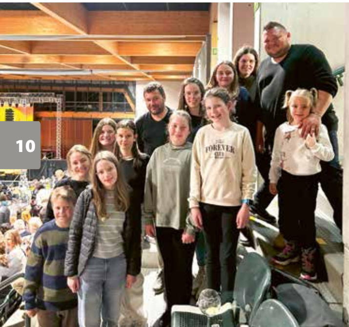
Der Besuch von König der Löwen in Bozen war ein tolles Erlebnis.