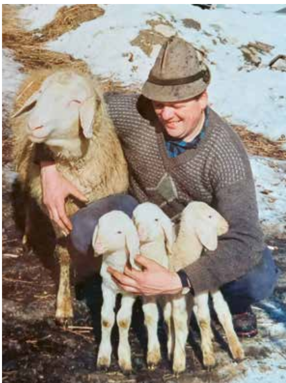
Der glückliche Schäfer nach einer gelungenen Drillingsgeburt Anfang der 80er Jahre