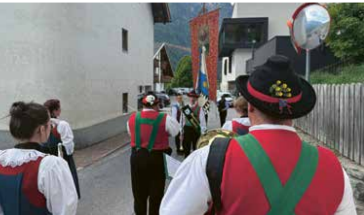
Auch bei der Erstkommunion mit dabei

Im Mai begleitete die Musikkapelle Martell zwei bedeutende kirchliche Anlässe im Dorfeschehen mit feierlicher Musik. Die Florianprozession am 4. Mai 2025 und die hl. Erstkommunion am 25. Mai 2025 wurden dabei musikalisch umrahmt.