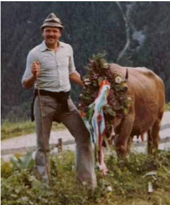
1983 - der junge Hirte mit seiner Lieblingskuh Fani

Und er erläutert auch gewisse Tricks, die es hier und dort anzuwenden gilt, um die Schafe unter Kontrolle zu halten. Dazu ist auch der treue Hund von großer Bedeutung, während er von Herdenschutztieren hier in Martell nicht viel hält.“ Weil auf 3000 Metern die Schafe Auslauf brauchen und viel zu viele Touristen den Weg kreuzen. Diese Herdenschutzhunde würden die Schafe nicht nach Fressen suchen lassen und die Wanderer angreifen. Und das ist beides nicht im Sinne der Sache“.