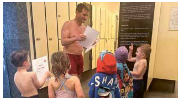
Die stolzen Schwimmer bei der Übergabe der Urkunde

wobei Spaß und positive Erfahrungen im Vordergrund standen. Die Kinder zeigten großen Einsatz während des Schwimmkurses und konnten so ihre Fortschritte spüren. Am Ende des Kurses erhielten sie eine Urkunde für ihren lobenswerten Einsatz.