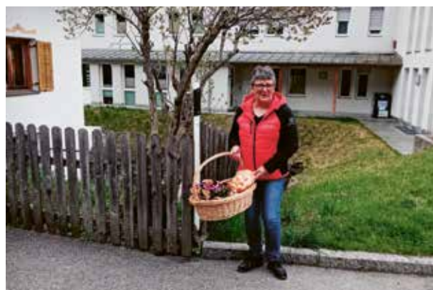
Ostergrüße für die Bewohnerinnen und Bewohner des Sozialzentrums

Mit einer besonders herzlichen Geste sorgten die Bäuerinnen rund um die Osterzeit für Freude im Sozialzentrum: Sie überbrachten den Bewohnerinnen und Bewohnern liebevoll gestaltete Ostergrüße – kleine Aufmerksamkeiten, die von Herzen kamen. Die Übergabe war nicht nur ein Zeichen der Wertschätzung, sondern auch ein Ausdruck gelebter Gemeinschaft.