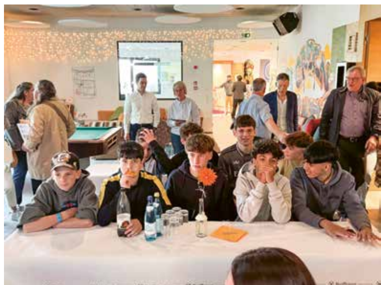
Jugendliche und Gäste