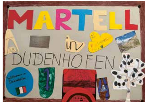
Kleine Kunstwerke der Kinder aus Dudenhofen