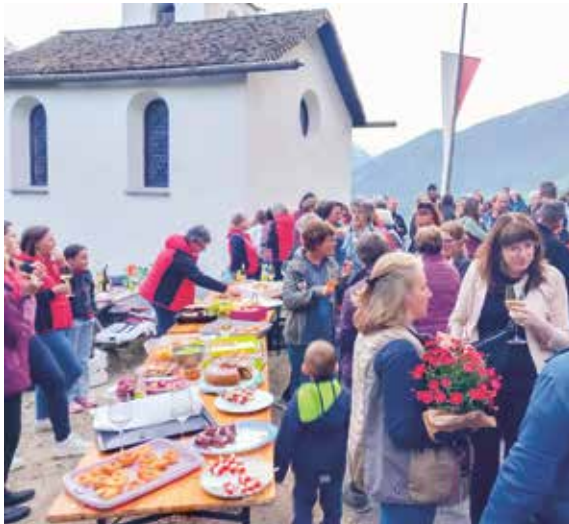
Maiandacht mit den Erstkommunionkindern