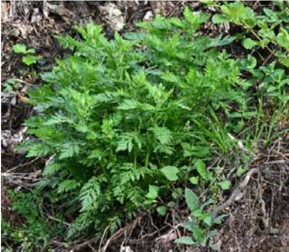
Einjähriger Beifuß - Artemisia annua

Stecklinge vermehrt werden. Eine hochdosierte Teekur für ca. 2 Wochen im Jahr trägt nachweislich zur Immunstärkung bei.