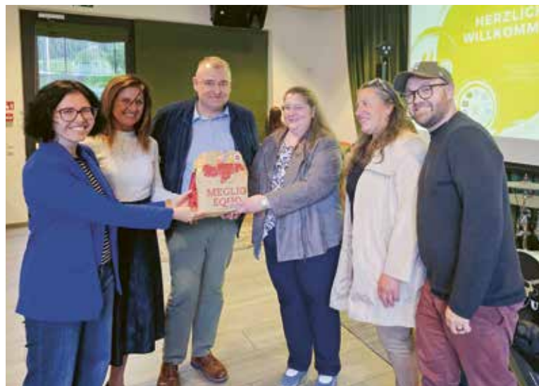
Geschenkübergabe von der AGJD an den Jugenddienst Mittelvinschgau

Ein großes Dankeschön an alle, die uns in den 40 Jahren begleitet und diesen besonderen Moment mit uns gefeiert haben.