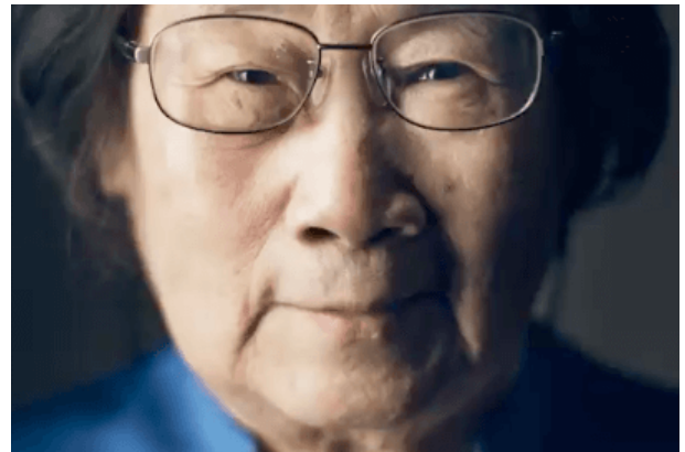
Die Nobelpreisträgerin Tu Youyou

Die Entdeckung von Artemisinin, einem Inhaltsstoff in Artemisia annua, war 1971 eine Sternstunde in der Malaria-Therapie. 44 Jahre später, im Jahre 2015 erhielt die chinesische Wissenschaftlerin Tu Youyou für diese Entdeckung und ihr Lebenswerk, das die Malariatherapie revolutionierte, den Medizin-Nobelpreis. Arte-