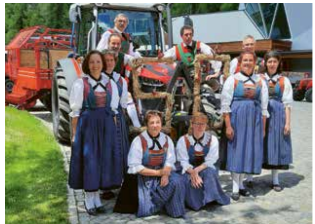
Auftritt der Volkstanzgruppe

Eine weitere Attraktion war die Maschinenausstellung diverser Firmen, welche Traktoren, Mähmaschinen und weitere Arbeitsgeräte zur Schau stellten. Am Nachmittag fand noch eine festliche Maschinenrundfahrt über „Rossgföll“ statt, an der alle Maschinen teilnahmen.