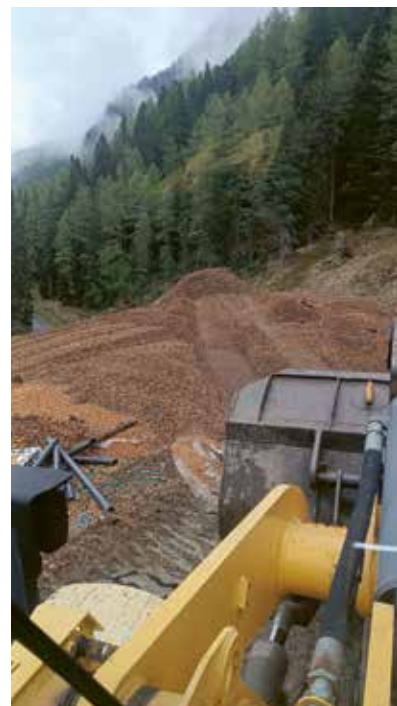
Das Schneedepot im Biathlonzentrum