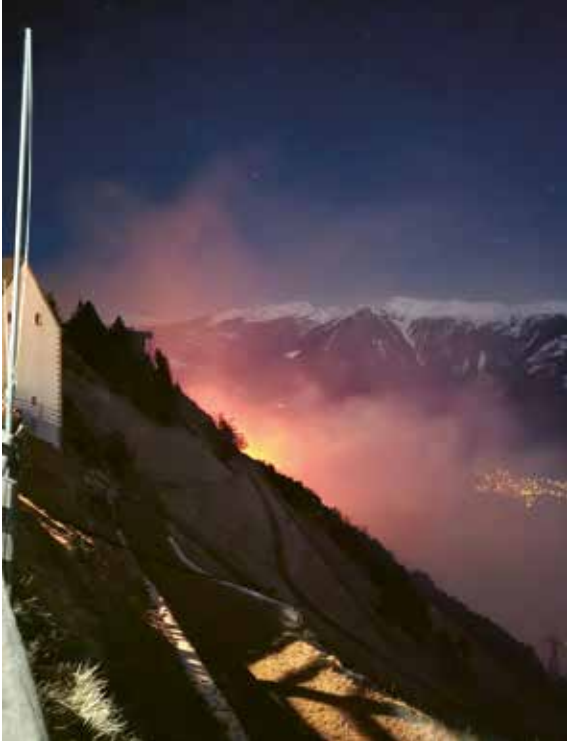
Der Brand bei Nacht in St. Martin mit Tarsch im Hintergrund