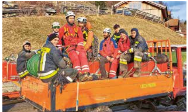
Die Feuerwehr Martell zusammen mit der Bergrettung vor Ort