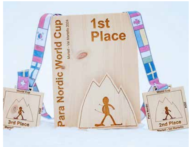
Die Pokale und Medaillen aus lokalem Zirbenholz, gefertigt von der Werkstatt für Menschen mit Beeinträchtigung der Bezirks-gemeinschaft Vinschgau.

Das Interesse an der Veranstaltung war groß, so wurde auch ein Beitrag über das Martelltal und den PARA Nordic Weltcup in der ARD-Sportschau gezeigt. Ein ganz besonderes Highlight war der Besuch der Schüler:innen der Grundschule von Martell, die alle Beteiligten anfeuert und für Stimmung im Stadion sorgten. Ein großes Danke geht, neben den zahlreichen freiwilligen Helfern, auch an die Werkstatt für Menschen mit Beeinträchtigung der Bezirks-gemeinschaft Vinschgau für Anfertigung der Pokale und Medaillen aus Zirbenholz, sowie an ADLATUS für die Mithilfe beim Transport. Die Ergebnisse der Rennen sind auf der neuen Webseite: www.biathlon-martell.com einsehbar.