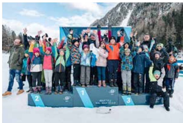
Die Schüler:innen der Grundschule Martell feiern die Sportler:innen an.