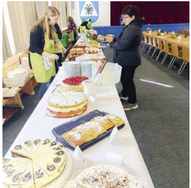
Vorbereitungen zur Walburgafeier

Am 17.2. durften wir zusammen mit der Bauernjugend Martell ein Gaudi-Rodeln in Grogg veranstalten. Alle Altersgruppen waren vertreten, von jung bis alt. Der Spaß beim Rodeln sowie bei den Zwischenstopps kam nicht zu kurz. Nach einer Stärkung in der Grogg-Alm fand die Preisverteilung statt, die Sponsoren waren wieder sehr großzügig – danke dafür.