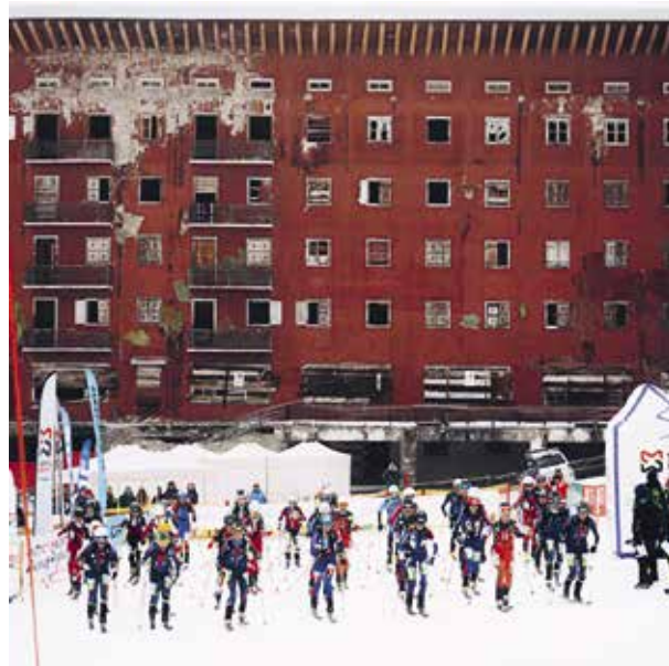
Verhüllt im Nebel: Das ehemalige Hotel Paradiso taucht den Startbereich des Einzelrennens in eine geheimnisvolle und mystische Atmosphäre.