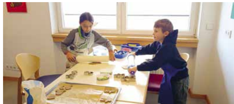
Das gemeinsame Keksebacken machte allen Spaß