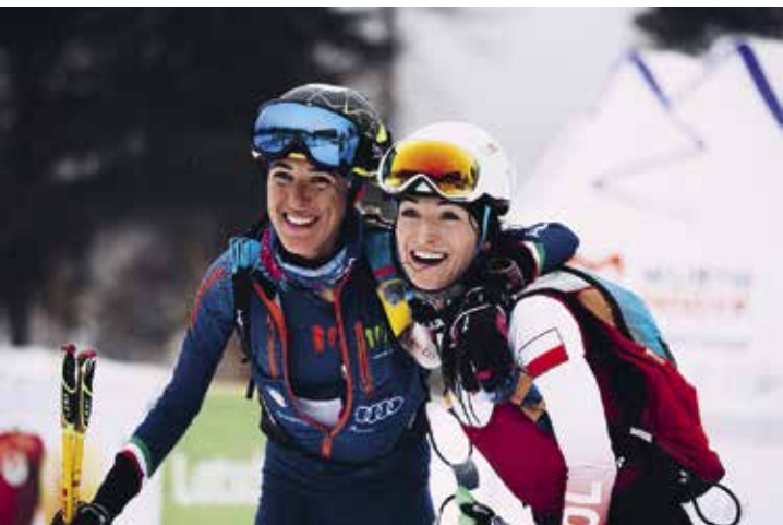
Die Freude bei Zielankunft nach 13,25 km und 1.366 Höhenmeter war bei allen Athletinnen sehr groß.