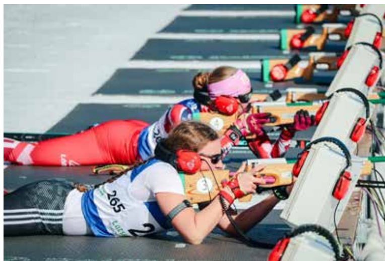
Die Kategorie Vision Impaired (Athleten mit Sehbeeinträchtigung) am Schießstand.

Pro Geschlecht gab es jeweils drei Kategorien: Sitting (auf Sitzskiern), Standing sowie Sehbeeinträchtigte, die in der Loipe mit einem Guide unterwegs waren. Sitzski ersetzen somit die