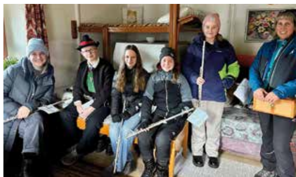
Auch in den warmen Stuben wurden gespielt.

Die Musikkapelle Martell bedankt sich herz-