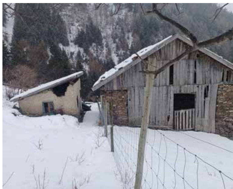
Das verahrloste Notunterkunft zur Bewirtschaftung von Bronta in den Jahren 1940 bis 1970 - mit Stadel