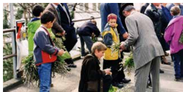
Buben beim Verkaufen von Palmbesen

Schon Tage vor dem Palmsonntag wurden von den Vätern und Buben Palmzweige gesammelt und zu „Palmbuschen“ gebunden. Am Palmsonntag, so ist es auch noch heute Brauch, wurden diese Sträuße dann geweiht und nach der Kirche von den Kindern gegen ein kleines Taschengeld verkauft. Ostern war und ist auch heute noch besonders für die Kinder ein besonderes Fest, denn dann gab und gibt es vom Paten oder der Patin einen Foachaz, diesen süßen, aus Weizenmehl gebackenen Hefezopf oder eine Hennenfigur. Nur zweimal im Jahr gibt es den und ist eine festliche, geschmackliche Abwechslung.