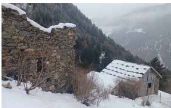
Bronta Februar 2026 -Stadel, provisorische Behausung-einst stand hier der untere Brontahof und Gemäuer des oberen Gebäudes