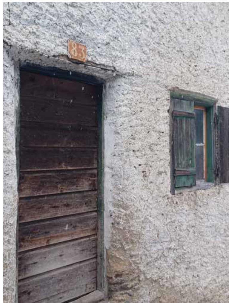
Haustür, Haus Nr. 83 - provisorisch errichtetes Gebäude