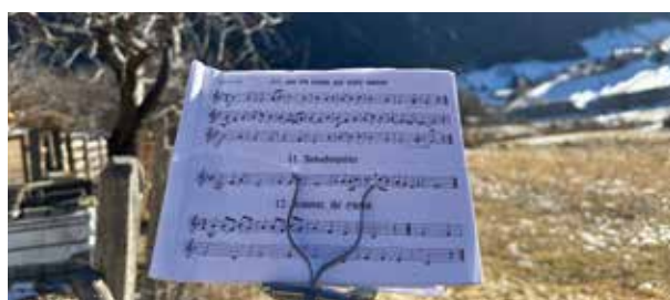
Der Andachtsjodler erklingt über Martell.