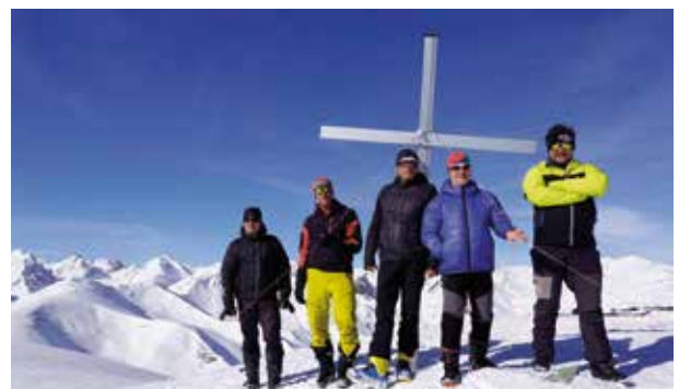
Skitouren Valle Stura und Maira

Vom 19. bis 23.02. machten wir uns auch heuer wieder auf den Weg ins südliche Piemont in die Skitourengebiete Valle Stura und Valle Maira. Anders als in Südtirol gibt es dort heuer Schnee in Hülle und Fülle. Bei tollem Wetter und besten Schneebedingungen – von Pulver bis Firn – erlebten wir fünf großartige Tourentage.