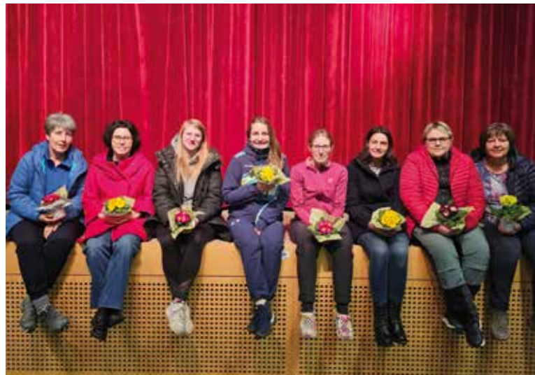
Die Mitglieder des Gemeindefrauenausschusses und des KVV Martell freuen sich über die gelungene Primelaktion in Martell.