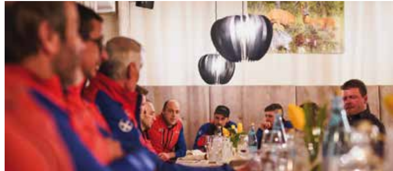
Jahreshauptversammlung im Marteller Hof