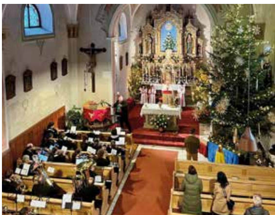
Festliche Umrahmung der Heilig-Tag-Messe durch die Musikkapelle Martell

Am Abend davor, am Heiligen Abend, spielten einige Musikantinnen und Musikanten um 23.00 Uhr im Martell Dorf klangvolle Weihnachtslieder und wünschten allen eine gesegnete und friedvolle Weihnachtszeit.