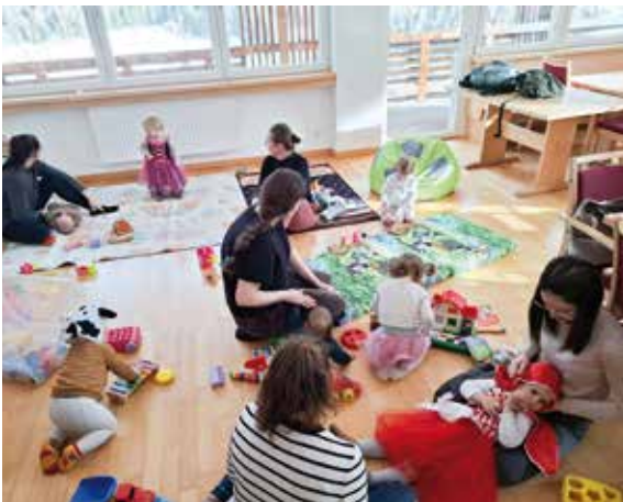
Beim Offenen Treff in der Faschingswoche konnten sich die Kleinen verkleiden.

Im Februar fand einmal in der Woche der offene Treff im Seniorenraum statt. In einer gemütlichen Atmosphäre konnten sich Eltern untereinander austauschen und die Kinder spielten gemeinsam. So wurden neue Kontakte geknüpft.