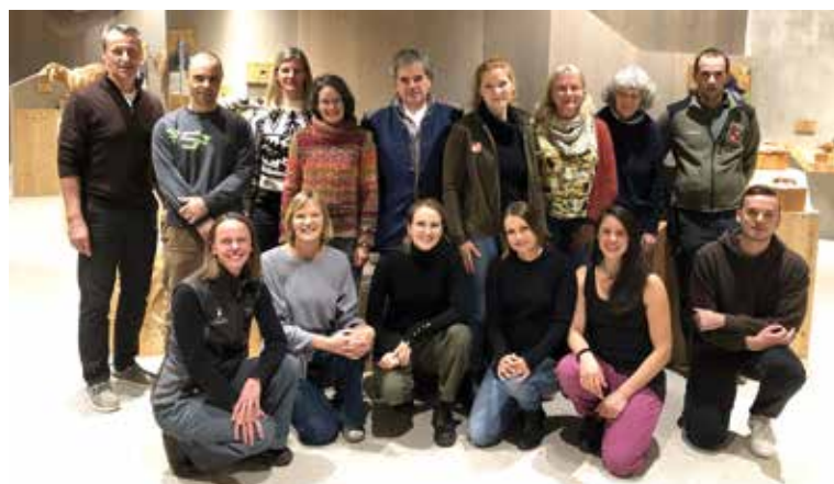
TeilnehmerInnen beim Jahrestreffen in Nordtirol/Längenfeld – Naturpark Haus

und teils auch die nähere Umgebung des Menschen wieder mit ihrer Anwesenheit bereichern. Die Rede ist von den sogenannten „Bilchen“ oder „Schlafmäusen“. Diese kleine, scheue Gruppe von Nagetieren umfasst den Siebenschläfer, den Gartenschläfer, die Haselmaus und den Baumschläfer. Speziell der Baumschläfer, aber auch die anderen Bilcharten, werden im Rahmen eines INTERREG-Projektes unter Koordination des Naturpark Ötztal im Dreiländereck Italien (Nationalpark Stilfser Joch), der Schweiz (Biosphärenpark Engiadina-Val Müstair) und Nordtirol (Naturpark Ötztal, Naturpark Kautertal) genauer unter die Lupe genom-