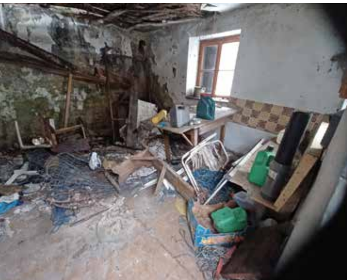
Innenansicht der in den 1950iger Jahren errichteten Unterkunft

die Fenster von Hitze mit schussartigen Knallen zersprangen. So konnten sie mit höchster Eile noch das nackte Leben retten. Aus einem Stall konnte der Bauer noch zwei Kühe und drei Ziegenböcke laufen lassen.