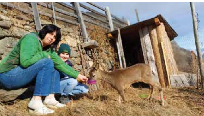
Verletztes Rehkitz zur Pflege am Berghof

Die Gemeinde Martell schaffte eine Drohne mit Wärmebildkamera an, die gemeinschaftlich von Bergrettung, Feuerwehr und Jägerschaft genutzt werden kann. Die Firma „TopHaus“ spendete Rettungskisten, die Helfer selbst erwarben ein Fischernetz zum leichteren Einfangen der Kitze und die Landwirte helfen durch rechtzeitige Meldung. Dank dieses Zusammenspiels konnten im Jahr 2025 bei etwa 30 Einsätzen innerhalb etwa eines Monats insgesamt zehn Kitze gerettet werden. Ein toller Erfolg! Im Jahr 2024 fand die Heumahd aufgrund des vielen Regens erst etwa zwei Wochen später statt, die Kitze waren schon größer und konnten nicht einfach mehr von den Fundstellen weggetragen werden, aber auch allein das Verscheuchen durch Mann und Hund hat sie vor den Mähmaschinen gerettet.