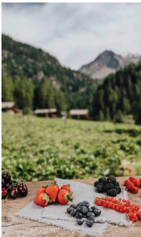
Südtiroler Qualitätsprodukte

Gerade diese breite Produktpalette unterstreicht die vielfältige Landwirtschaft und hebt die Rolle der Genossenschaft im Vergleich zu anderen des Landes besonders hervor. Diese Diversifizierung ist nicht nur agronomisch sinnvoll, sondern trägt auch zur Stabilität der Betriebe bei. Sie reduziert Abhängigkeiten von einzelnen Kulturen und verteilt Risiken auf mehrere Standbeine.