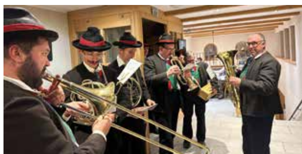
In drei Gruppen wird durchs Tal gezogen.

lich für die großzügige Unterstützung sowie für die vielen offenen Türen und die überall erfahrene Gastfreundschaft im Tal.