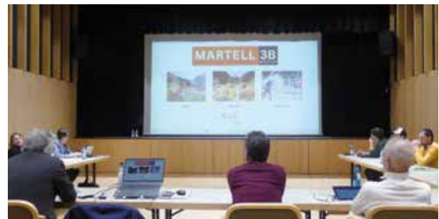
Das Modell "Berge, Beeren und Biathlon" wurde vorgestellt

Die Vorstellung diente vor allem dem Austausch zwischen den Gemeinden. Ob und in welcher Form Stilfs künftig ähnliche Wege gehen wird, soll erst entschieden werden.