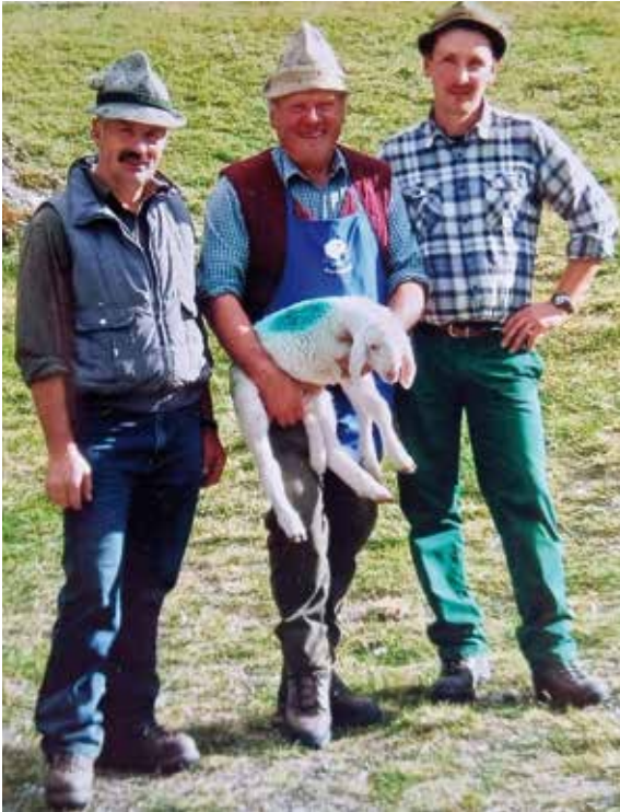
Die drei Almmeister

Die Liebe zu ihren Tieren hört man aus jedem Satz, wenn die vier Schäfer erzählen. Sie erkennen viele Tiere schon am Klang der Schelle oder das Tier selbst „am Hinterteil“ und müssen gar nicht erst auf die Ohrmarkierungen schauen, um zu wissen von welchem Bauern welches Schaf stammt.