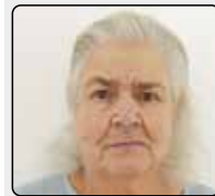
Platter Maria Anna