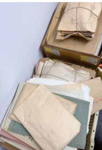
Zahlreiche Schätze aus vergangenen Jahren liegen dort.