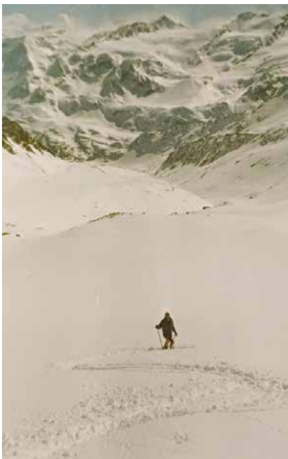
Madritschjoch herunter, Ortlergebiet im Hintergrund etwa 50er Jahre