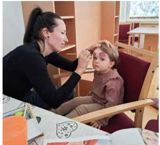
Auch geschminkt wurde zu Fasching