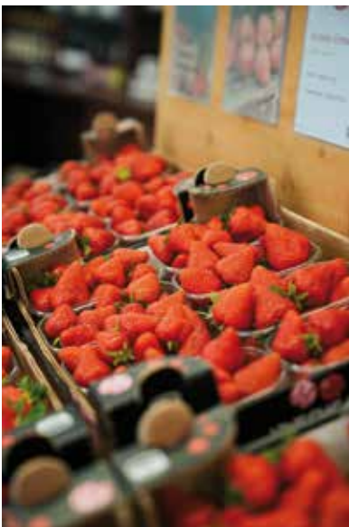
Erntefrische Erdbeeren in der Erdbeerwelt

Der Anbau von über zehn verschiedenen Obst- und Gemüsekulturen steht für eine besonders vielfältige Landwirtschaft im Martelltal und verdeutlicht eindrucksvoll, wie nachhaltige landwirtschaftliche Entwicklung im alpenländischen Raum erfolgreich umgesetzt werden kann.