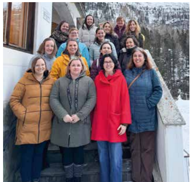
Gruppenfoto beim Jubiläumssessen